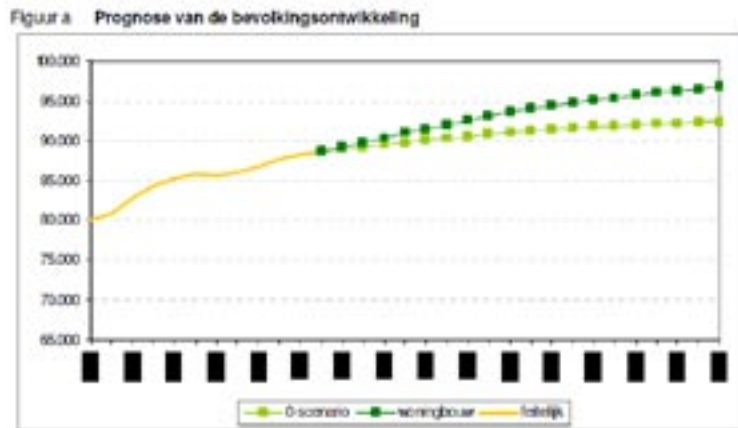
Bevolkingsprognose Helmond tot 2030 (O&S Helmond)

o-scenario: bevolkingsgroei alleen ten gevolge van geboorte en sterfte woningbouw: bevolkingsgroei als er tot 2030 5700 huizen worden bijgebouwd